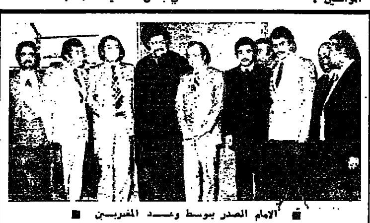
الامام الصدر يوسط وفد المشرعين

الصدر لوفد الجامعة اللبنانية بيان نافذة حضارياً على العالم استقبل قبل ظهر امس سماحة الامام السيد موسى الصدر رئيس المجلس الاسلامي الشيعي الاعلى، ورئيس الجامعة اللبنانية في العالم الدكتور شاهر الراعي والامين المساعد للجامعة المنهني حبيب ابو جوده والامين العام المساعد العلمي رشاد سلاسل وامناء وفد المشرخين ورؤساء المجلس الوطنية للجامعة.